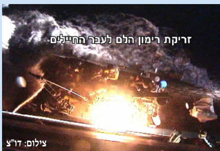
זריקת רימון הלם לעבר החיילים